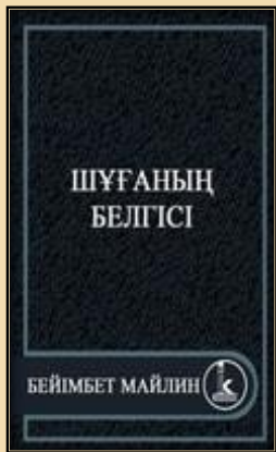
«Шұғаның белгісі» аудиокітап